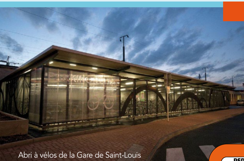
Abri à vélos de la Gare de Saint-Louis