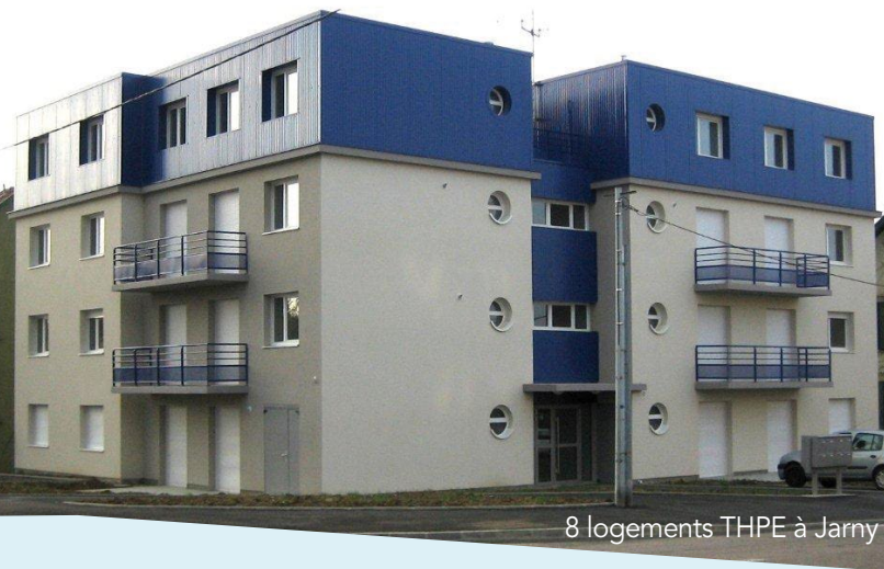
8 logements THPE à Jarny