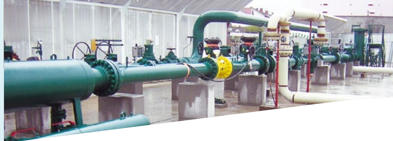
Station de compression pour GRT GAZ