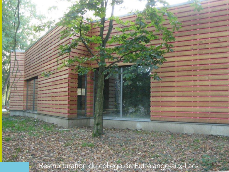
Restructuration du collège de Puttelange-aux-Lacs

La Direction Travaux-Services propose à ses différents clients ( administrations, collectivités locales, industriels, commerçants... ) son expertise et son savoir-faire en s'adaptant aux contraintes de chacun : qualité, respect des délais, optimisation des coûts, travaux en sites occupés, reprises de sinistres, travaux spéciaux, etc.