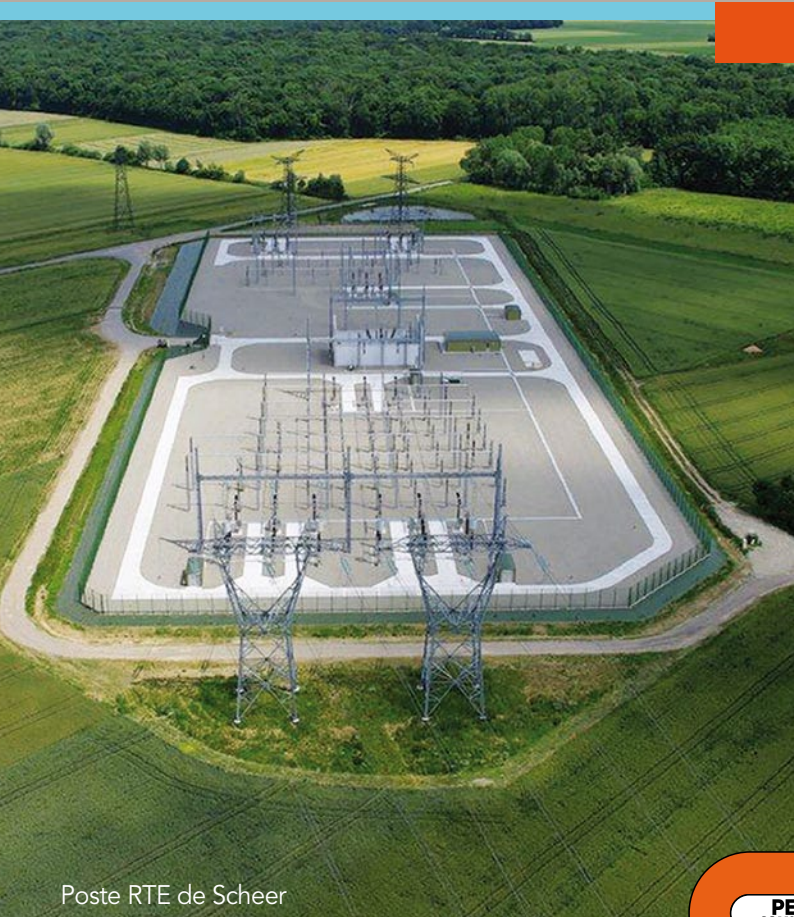
Poste RTE de Scheer

Au travers de nos multiples opérations, nous avons acquis une expertise reconnue dans la réalisation de bassins d'orage, de bassins de stockage d'eau potable et d'ouvrages hydrauliques divers. ”